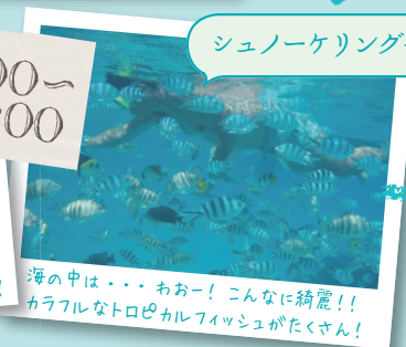
海の中は... おおー! こんなに綺麗!!カラフルなトロピカルフィッシュがたくさん!