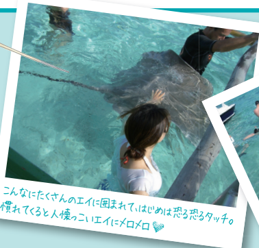
こんなにたくさんのエイに囲まれて、はじめは恐る恐るタッチの慣れてくると人懐っこいエイにメロメロ