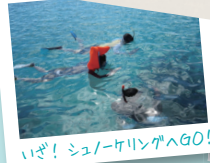
いざ! シュノーケリングへGO!