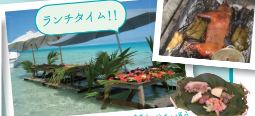
この日のランチのメインは子豚の丸焼き! かあいそうだけど...美味しそう! その他タヒチの名物料理ポワソクやタロイモなどタヒチ料理が楽しめます