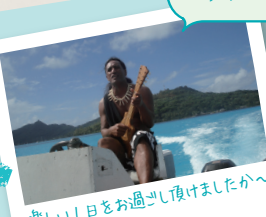
楽しい日をお過ごし頂けたか～お疲れ様でした