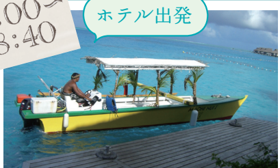
ホテルのポートにて本島へ、またはホテルへ直接お迎えにあげます