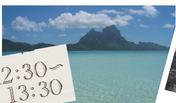
モツピクニックで上陸する無人島からの眺め。オテマア山が綺麗に見えます。モツでのフリタイムをお楽しみください