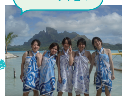
パレオで記念撮影★パシャ!